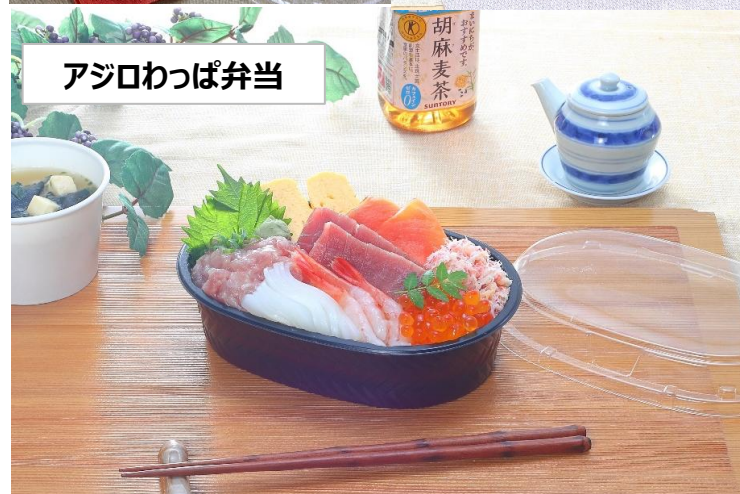
アジロわっぱ弁当